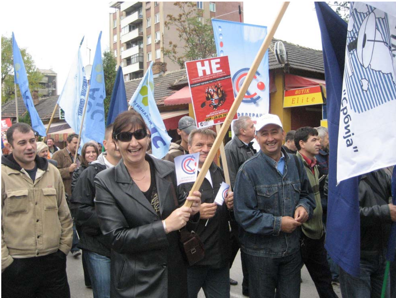
Protestna šetnja ulicama Bora