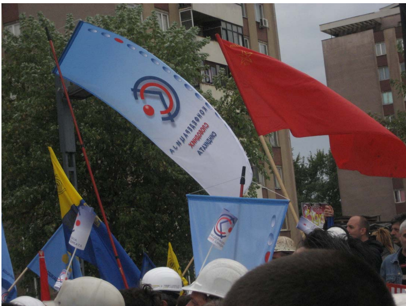
Simbolika ili slučajnost, pored naše zastave i ona skoro zaboravljena